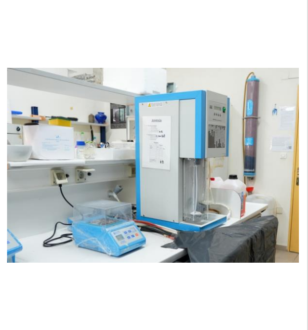
Συσκευή χώνευσης Kjeldahl και συσκευή απόσταξης