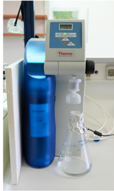
Συσκευές παραγωγής απιονισμένου και υπερκάθολου νερού