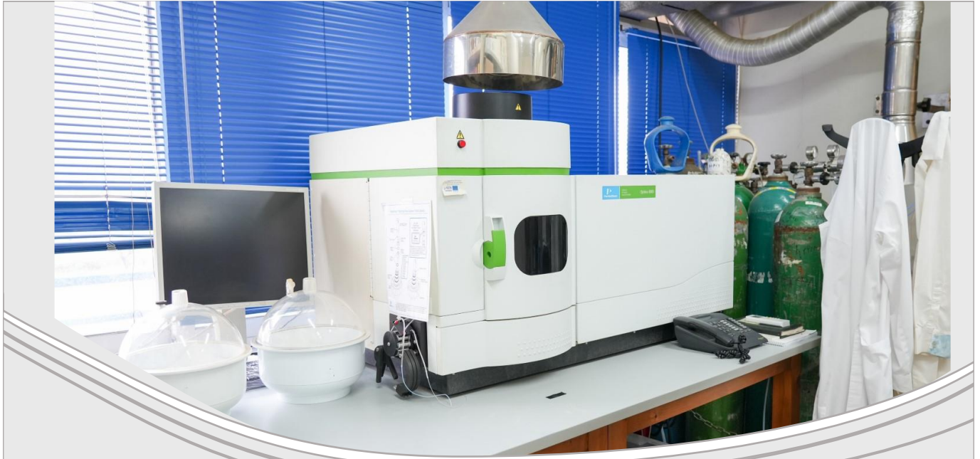
Optima 8000 ICP-OES (Perkin Elmer)